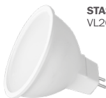
STAS Wi-Fi smart-led VL20300