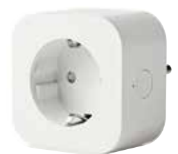
STAS Wi-Fi smart plug VT30700