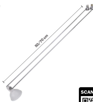
STAS multirail armatuur GU5.3 classic chroom incl. STAS Wi-Fi smart-led VA35516 50 cm VA35716 70 cm