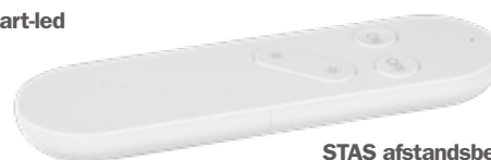
STAS afstandsbediening voor STAS Wi-Fi smart-led VT40800