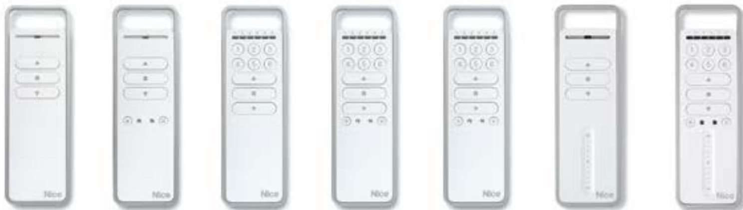
P1 P1S P6 P6S P18 P1V P6SV