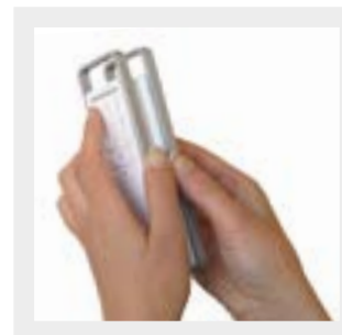
Eenvoudige automatische duplicatie door twee zenders naast elkaar te houden.