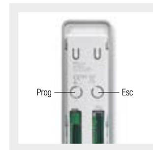
Intuïtieve programmeringsprocedure met de toetsen op de achterkant van de zender.