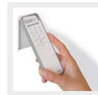
Handige wandsteun, standaard geleverd.